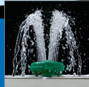
AXION MSR 洗眼/脸器

Haws Integrated 生产和安装定制化的温水系统冲淋方案，以符合ANSI标准对水温的要求。